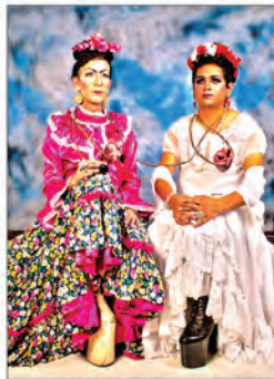
blankz blowz - el maquillaje de la vida - de la peluca a los tacones