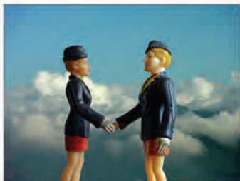
jean-rené maendly díaz - equidad - tercer lugar -