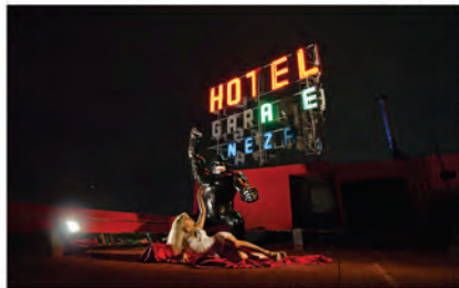
arturo garcía trinidad - derecho de réplica - primer lugar -